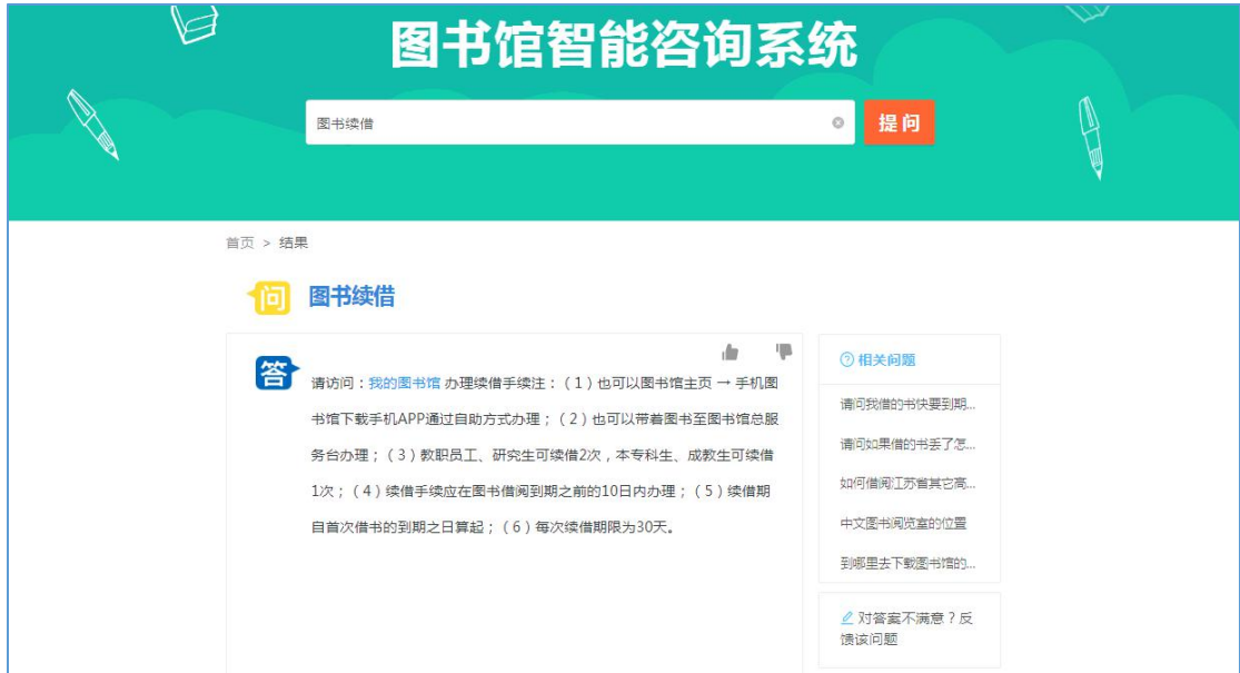
图 4 业务办理展示