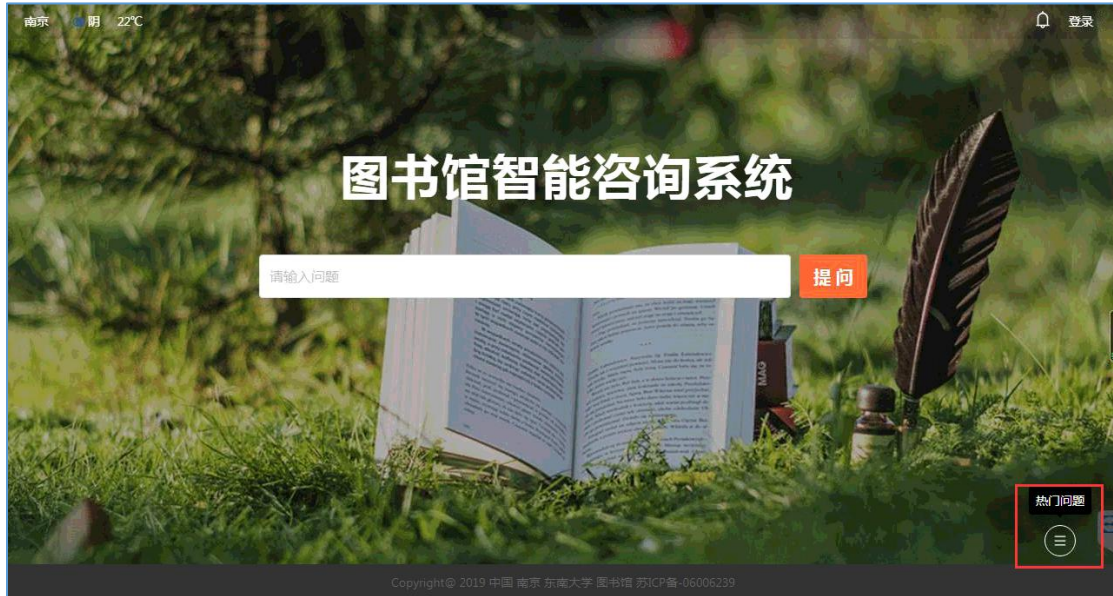
图 1 热门问题

支持馆藏书目检索、图书馆业务咨询和业务办理导航、资讯讲座、知识百科、天气等信息检索。采用一框式搜索问答形式，输入问题时有关联词提示。点击右下角热门问题按钮，展示问题示例。