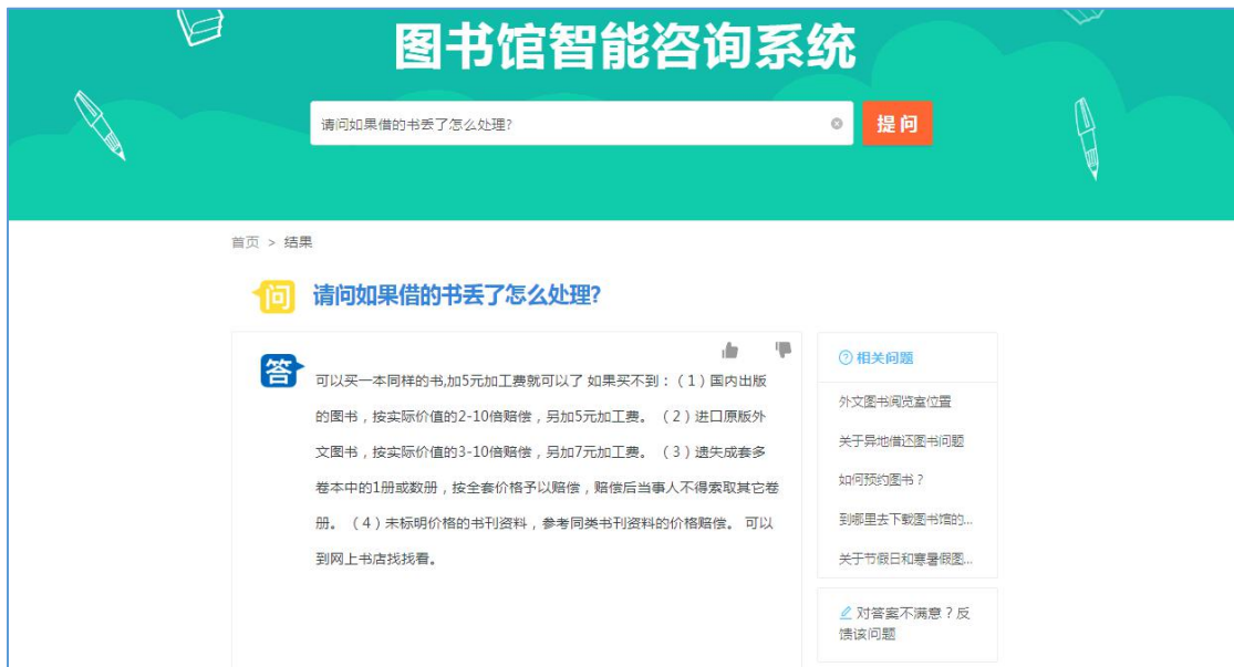
图 3 业务咨询展示