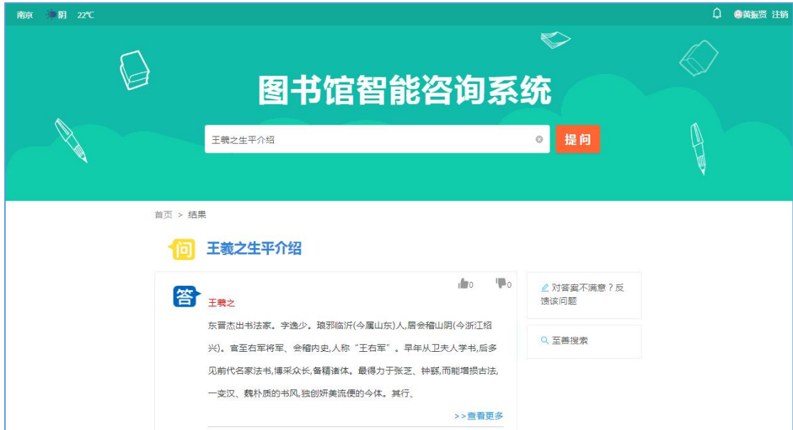
图 5 百科问答展示