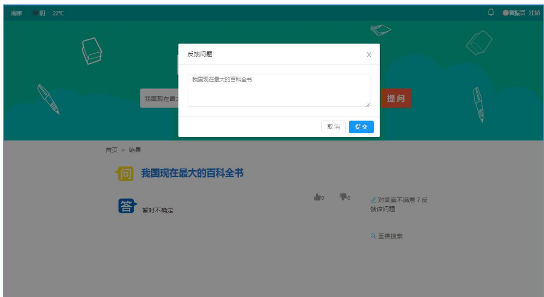
图 9 答案反馈-1

搜索的问题已有答案，对答案不满意，可以点击右侧“对答案不满意？反馈该问题”。同弹出提交问题对话框，点击提交，成功后有提示“感谢您的反馈！”。