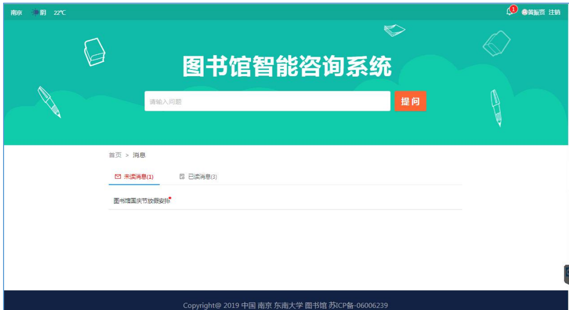
图 8 答案提示