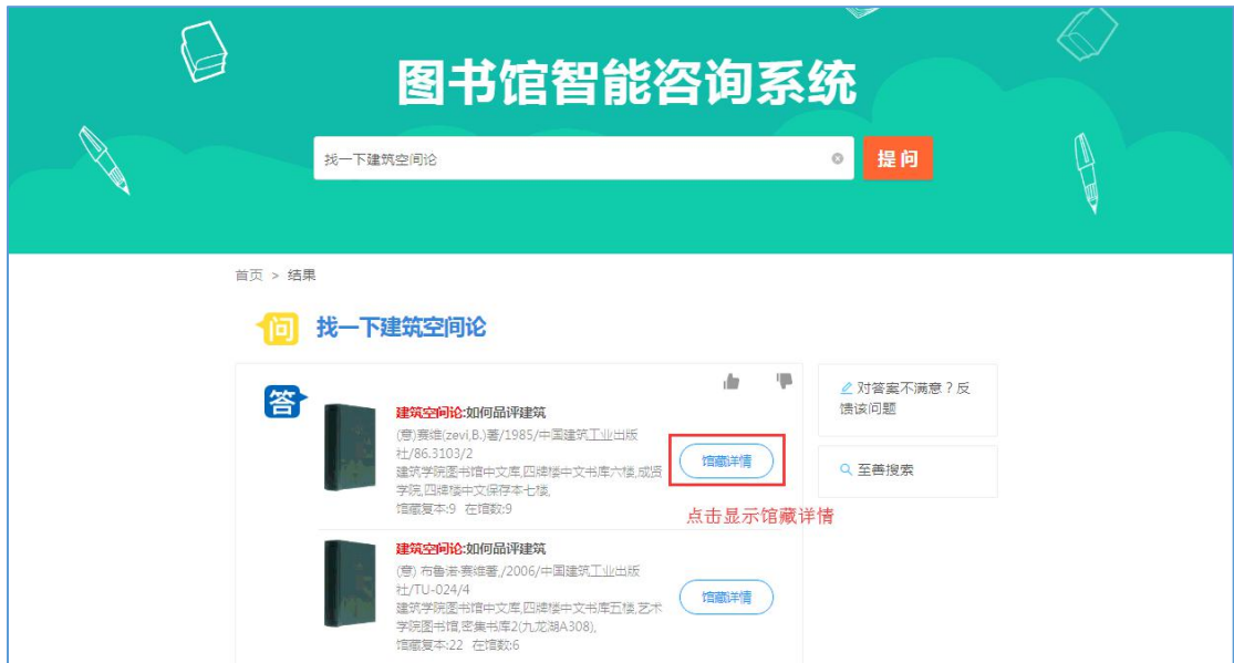
图 2 馆藏详情展示