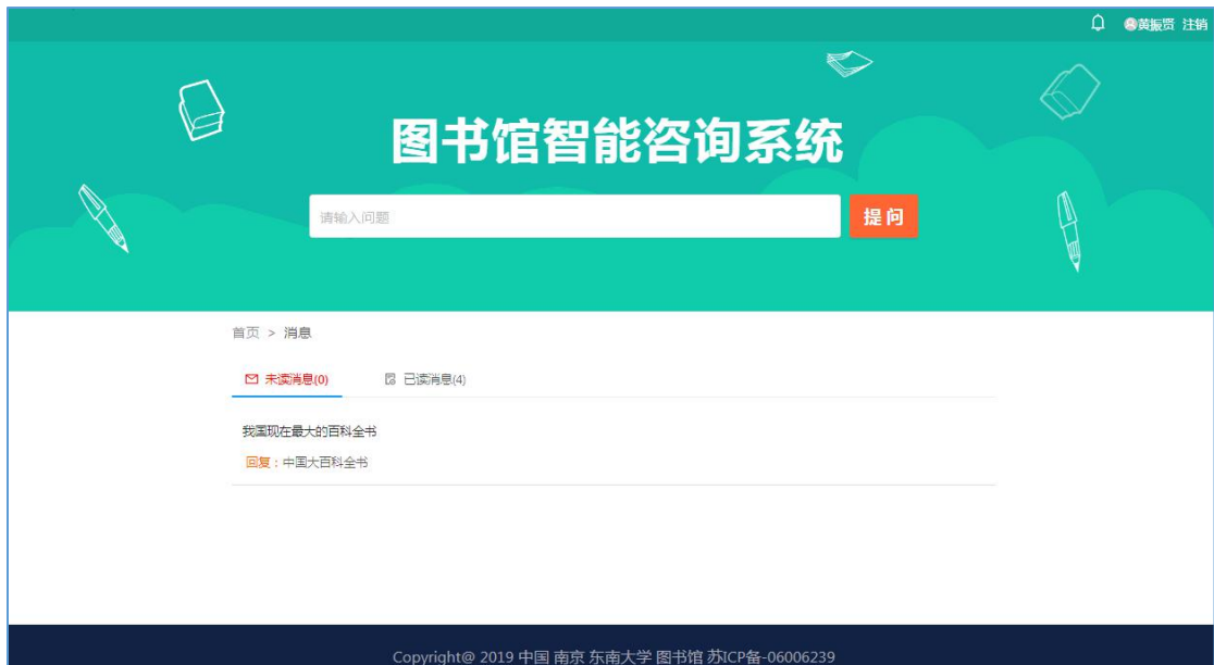
图 10 答案反馈-2