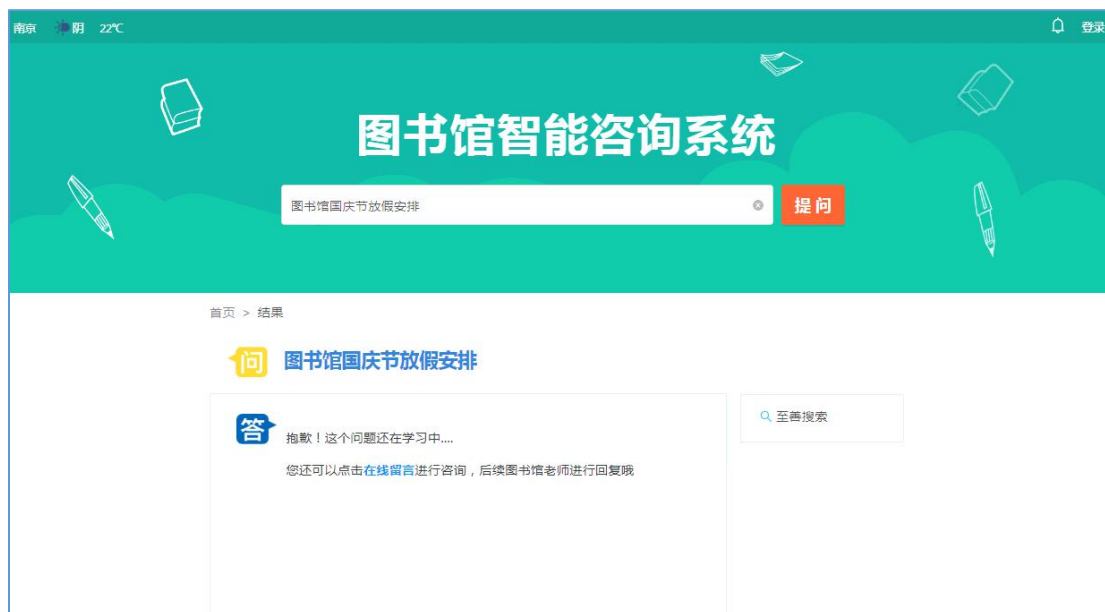
图 6 问题反馈-1

输入问题没有答案时，点击在线留言提交问题（注：登录用户才有权限提交问题，未登录提示“您还未登录，请点击右上角登录后再次提交”，输入读者条码号、密码登录系统）。