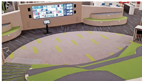
图5 NTU李伟南图书馆研究共享空间中心活动区 [29]

SMU李嘉诚图书馆学习共享空间转角处的家具常被移至一旁,用以举办学术讲座、图书签售等各色校园活动。NTU李伟南图书馆科研共享空间的中心区域设置了阶梯式座位,用于举办讲座等活动,无活动时供学生休闲阅读或讨论(见图5) [29] 。另外,NTU于2015年在学校学习中心(The Hive)开放了图书馆小站(Library Outpost),在这个不到400平方米的空间内,每天举办19分钟的小讲堂,每周举办读者分享活动,供学生们讨论科研热点、分享新发现等 [30] 。