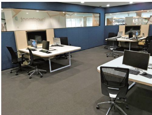
图4 SMU李嘉诚图书馆投资工作室

金融终端的一体机等,以支持金融管理等学校优势专业的发展(见图4) [26] 。NUS中央图书馆正在筹备创客中心的建设,计划为学生引进更多可动手实践的高新设备,以丰富学生与高科技的互动体验,培养其创新创业能力 [163] 。