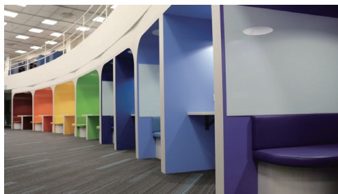
图 1 NTU 李伟南图书馆研究共享空间中的车厢式隔间 [19]

NTU 于 2010-2011 年在李伟南图书馆与商学图书馆内新建学习共享空间, 提供式样、大小一致的厢式讨论舱、录播间等 [18] 。2016-2017 年, 李伟南图书馆将学习共享空间升级为研究共享空间, 提供多种式样的协作空间, 如不同规模的半开放式圆形隔间、车厢式隔间 (见图 1)、U 形桌与条形桌组合的开放式授课空间 (见图 2)、小圆桌与布艺板凳搭配的闲聊空间等 [19] 。SMU 李嘉诚图书馆于 2013 年的空间再造中, 将圆桌与沙发椅组合而成的协作学习区转变为 24 小时开放的学习共享空间, 提供不同大小形状的多人桌、咖啡厅式休闲座椅、设备齐全的研讨间等; 并在转角空间设置可移动、组合的桌椅, 配备投影、移动白板, 利用窗台空间摆放了五台一体机, 可用作团体项目讨论、教师授课等活动 (见图 3) [20] 。NUS 中央图书馆现有的协作与社交空间只设置了可移动的休闲沙发及自动售卖机, 未来规划改建为提供一站式服务的研究共享空间 [21] 。