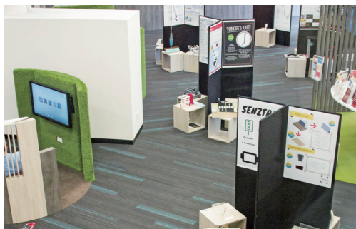
图6 NTU李伟南图书馆研究共享空间展示区 [31]

参观者可以发表评论或建议(见图6) [31] 。NUS中央图书馆2018-2020年的空间再造项目第一阶段即是在一层大厅打造可供师生充分交流互动的展示区域 [21] 。