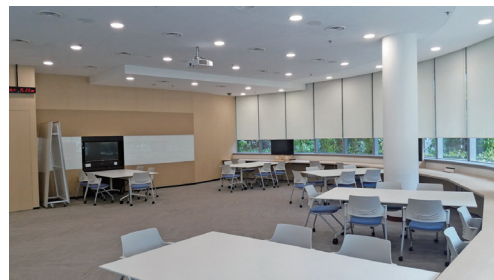
图 3 SMU 李嘉诚图书馆学习共享空间转角处